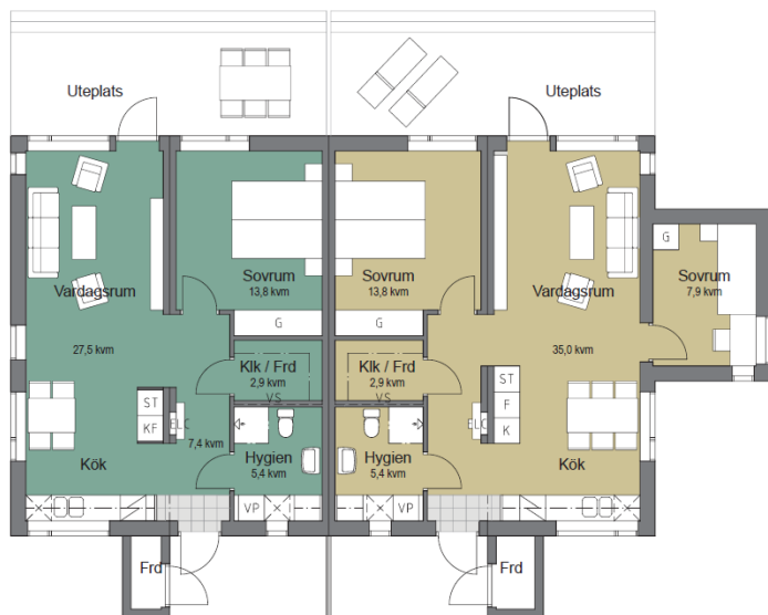
2 ROK, 59 kvm